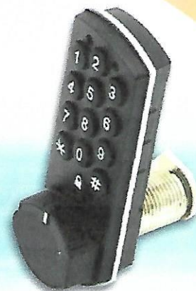
ECO 10 SMART KEY